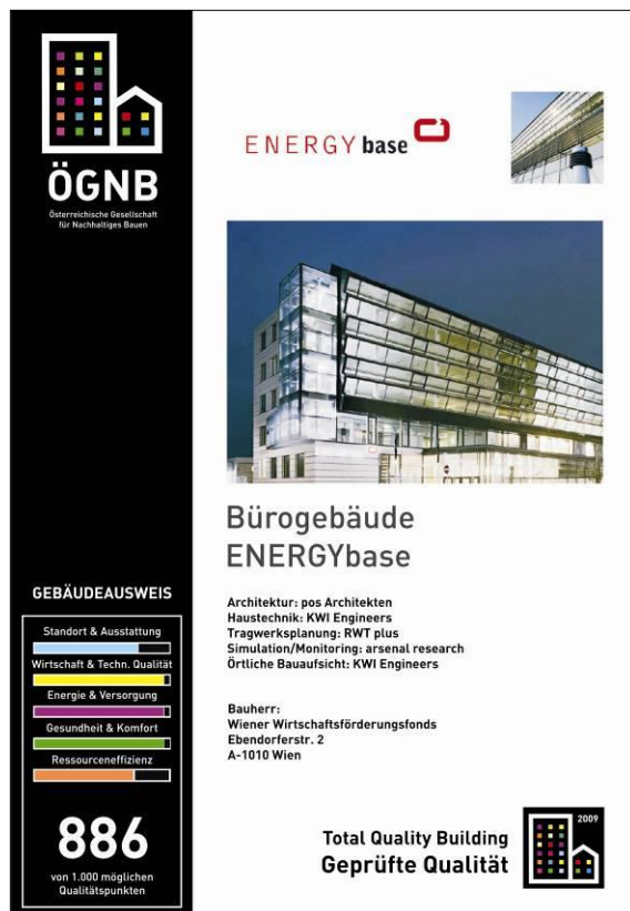
Abbildung 2: Vorschau Gebäudezertifikat TQB